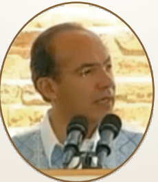
Felipe Calderón Hinojosa, Presidente de México

“La ciudad de Atzompa era, no sólo un barrio de Monte Albán, sino era el lugar de sus sacerdotes y sus gobernantes. Por sus dimensiones es la zona más grande en el territorio ocupado por los zapotecos”.