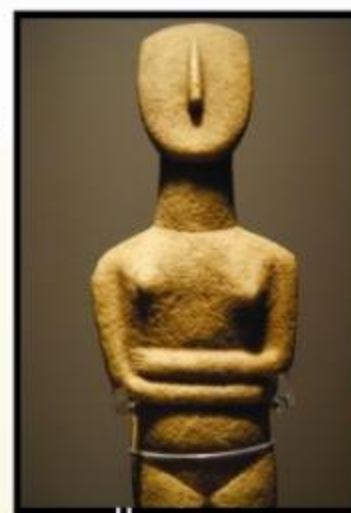
Figura de mármol de una mujer

Procedencia: Tívoli, Italia. Antigüedad: Siglo II, d. C.