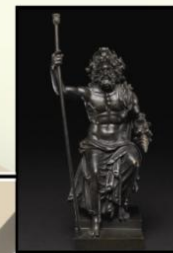
Figura de bronce de Júpiter sosteniendo un cetro y un rayo

Procedencia: Villa de Adriano, Italia Antigüedad: 117-118 d. C.