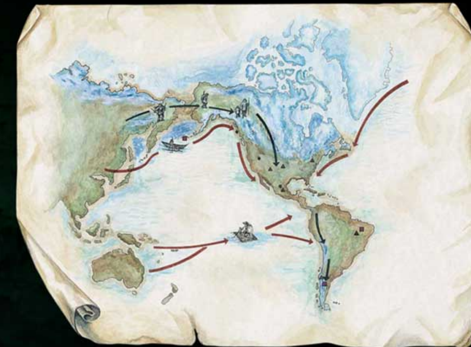
Mapa: Carmen Rojas