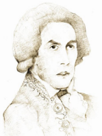
MANUEL TOLSÁ (1756-1816)