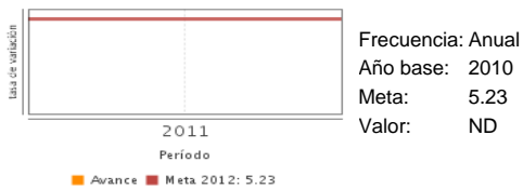
Porcentaje de monumentos históricos intervenidos para su conservación