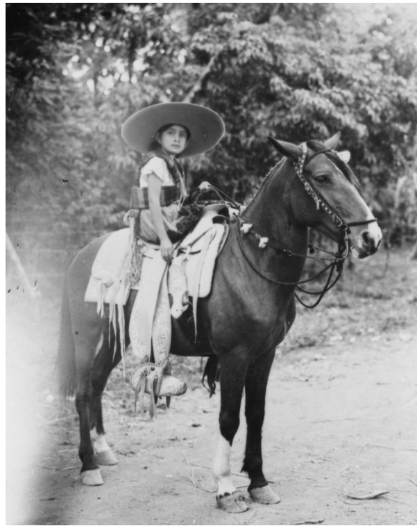
Autora Carmen Cook. Fondo Carmen Cook, ca. 1940, Cuautla, Morelos, México.

Los materiales, producto de prácticas culturales, sean o no consideradas artísticas, se vuelven fuentes históricas que han sido percibi-