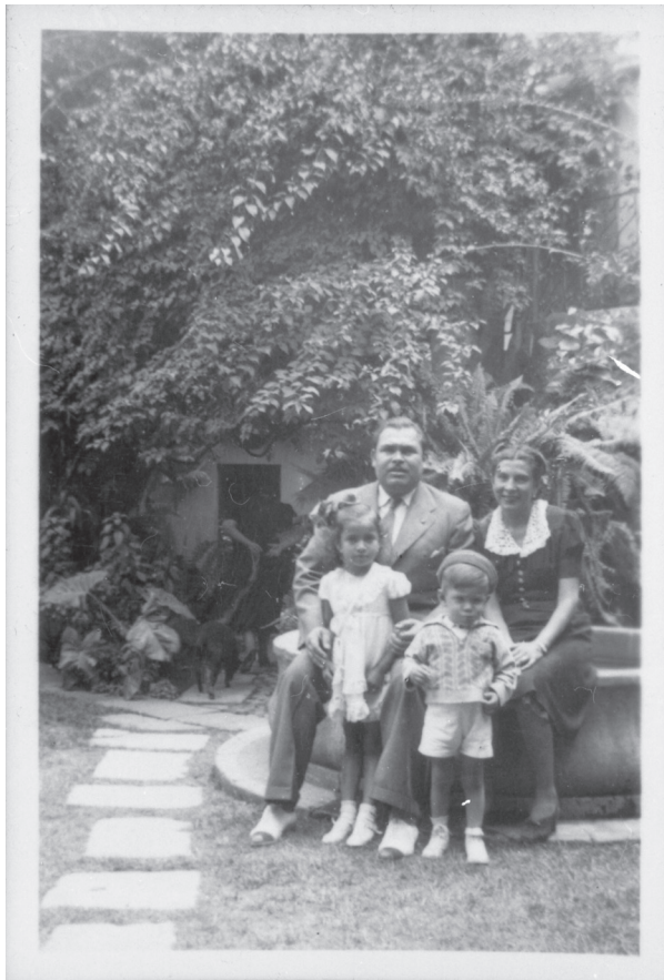
Autor no identificado, Familia de época, retrato, ca. 1945, Cuernavaca, Morelos, México. No. Inventario: 479

Asimismo, en muchas de las fotografías de la época entre la década del cuarenta y cincuenta, es posible pensar que fueron tomadas por un fotógrafo o una persona dedicada esta labor, aún no se había masificado el uso de la cámara fotográfica, debido a sus dimensiones y procesos técnicos para tomar una fotografía.