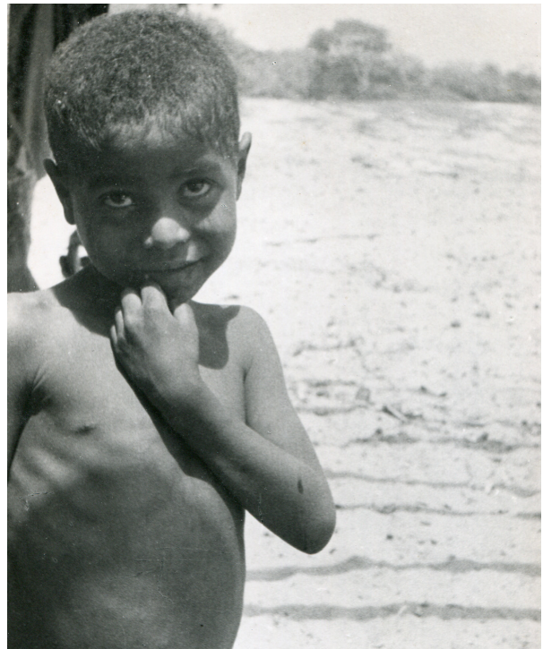
ca. 1925, Acapulco, Guerrero, México.

En el segundo rubro se encuentran aquellas fotografías donde las niñas y los niños usualmente no salen acompañados de una mujer y un hombre, posiblemente eran los padres. La vestimenta puede ser "más austera" o nula, y en muchas ocasiones sin zapatos. Las niñas y niños y personajes que salen con ellos, pueden estar retratados en el suelo; situación que no vemos en las imágenes que buscan retratar a las clases con mayores recursos económicos. Generalmente a los personajes se les ve sentados o de pie. En nuestra cultura el suelo tiene un valor simbólico que suele construir la noción "de lo bajo", de "lo inferiorizado". El suelo puede ser un elemento con el que se pretenda construir la noción de "pobreza".