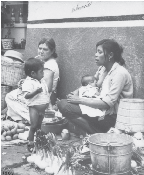
Autor no identificado, Mujeres vendiendo sobre la calle, ca. 1963 Cuernavaca, Morelos, México, No. Inventario: 477.

tomarse una foto sobre un caballo, hecho probablemente de un material plástico, y con una manita de tras que tenía un dibujo de una cascada o de un cerro. Probablemente estas fotografías fueron parte de la subjetividad de la niñez o de los recuerdos de la niñez, para un sector social que habitaba o habita en Morelos.