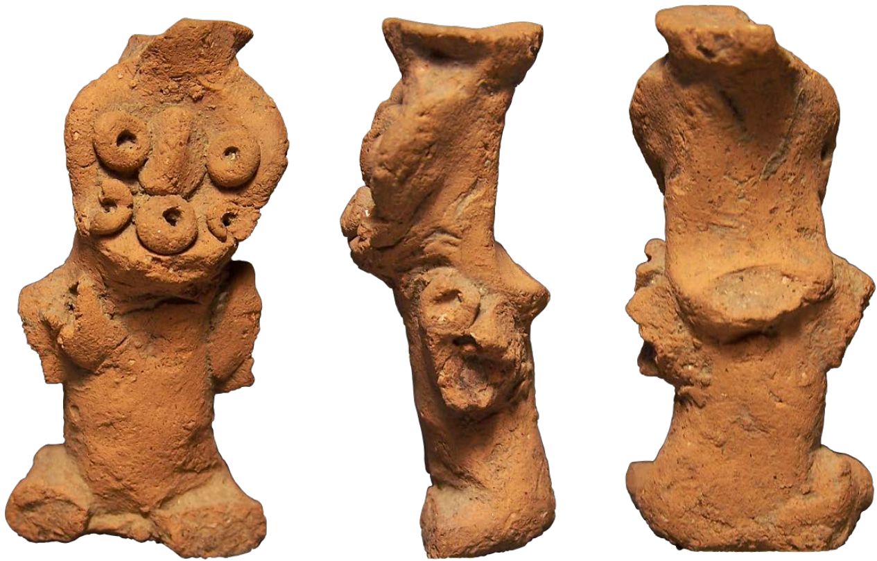
Figura 7. Figurilla Chilacachapa a) Anverso b) Perfil izquierdo c) Reverso. Con base a fotografías de P. A. Aaron U. Romero Rodríguez.

de forma lateral, a través del muro Este de la cámara; trazando el pozo con medidas de 1 m por 1 m y ubicado a 70 cm en dirección Este y 70 cm al Sur de la boca del tiro (Pineda y Hermosillo, 2012:18-22) (Figuras 4, 5 y 6).