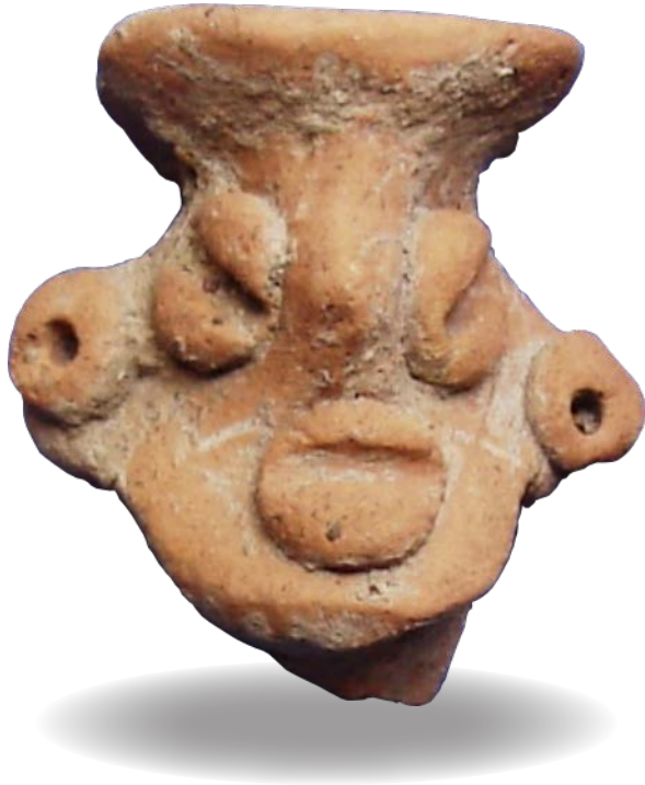
Figura 8. "Carita" de Maxela, municipio de Tepecoacuilco de Trujano.

gurilla que exhibe características parecidas a la de Chilacachapa; manufacturada en similar clase de barro color café rojizo, rostro semiredondo, ojos y boca tipo grano de café (no coincidentes), orejas discoidales y nariz abultada, pero, principalmente, ostenta un evidente objeto trapezoidal en el tocado. Sus rasgos, también, nos sugirieron que los discos ubicados en las mejillas de la efigie de Chilacachapa podrían corresponder a orejas localizadas en un área no convencional del rostro (Figura 8).