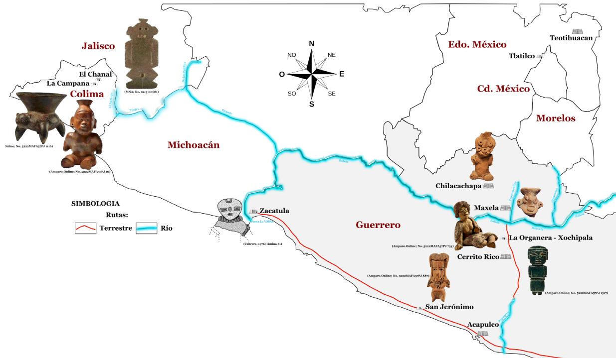
Figura 1. Las figurillas prehispánicas de Guerrero. Chilacachapa y vínculos morfológicos con otras áreas culturales.

Al realizar trabajo arqueológico de campo en Guerrero, encontrar figurillas de alto valor estético y en buen estado de conservación es poco común. No es sino por saqueo de contextos funerarios, actividad prolífica en todas las regiones del estado, habiendo poblaciones enteras que sobreviven económicamente a expensas de ello, como el caso de Maxela y varias otras de la Región Norte, de la que trataremos más adelante, que se conocen los tipos afamados encontrados en territorio guerrerense, descollando las deno-