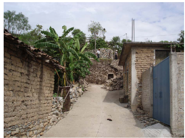
Figura 2. Chilacachapa, zona Centro, panorámica Este - Oeste de la Estructura A1 subiendo por calle Calvario.