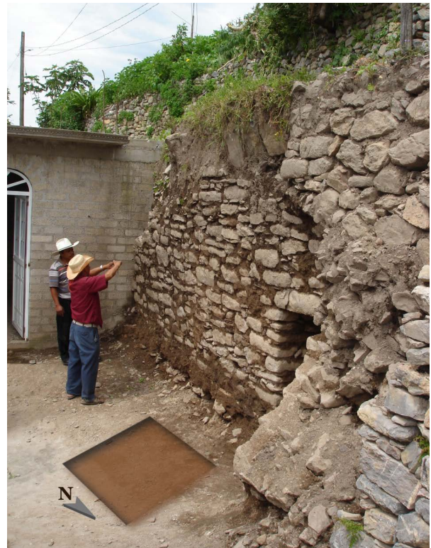
Figura 4. Ubicación del pozo 1S - 1E, vista Noreste – Suroeste.

A lo largo del trabajo de exploración la única figurilla de cerámica recuperada surgió durante la remoción del relleno extraído al excavar el primer nivel (60 cm a 1.00 m) del pozo 1S – 1E (que llegó a 2.32 m de profundidad), abierto para crear un acceso provisional para llevar a cabo la intensa labor a realizar, siendo necesario crear una vía alterna de mayores dimensiones, ya que el tiro original de entrada a la cámara funeraria es de dimensiones reducidas y podía resultar afectado. Con este objetivo se consideró entrar