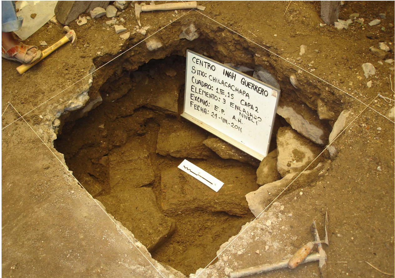
Figura 5. Excavación pozo 1S - 1E, vista Noreste - Suroeste