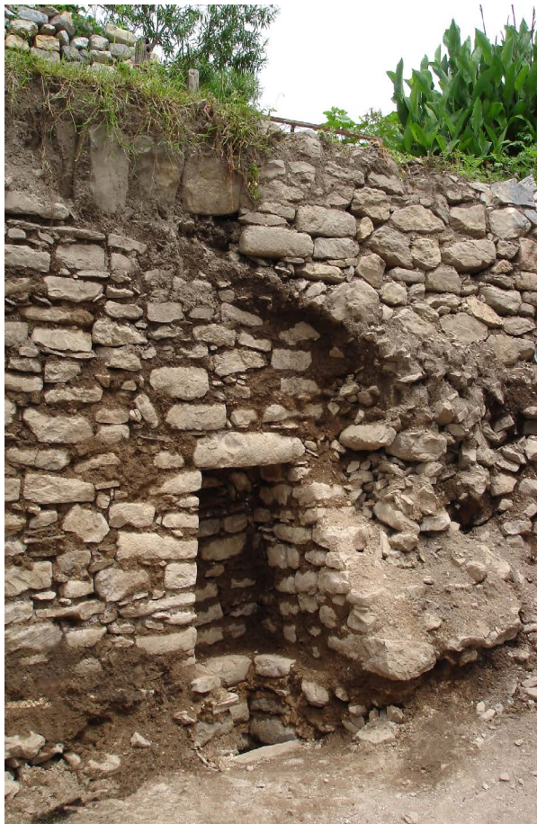
Figura 3. Acceso principal a la cámara funeraria de Chilacachapa, vista Sureste – Noroeste.

En el año 2011 se realizó en la población de Chilacachapa, municipio Cuetzala del Progreso, Región Norte, un rescate arqueológico que tuvo como objetivo explorar lo que se identificó como una cámara funeraria subterránea, descubierta al colapsar una sección del muro perimetral adosado a un montículo prehispánico (estructura A1) ubicado al Oeste de la colonia Centro, sobre el que desplantan actualmente inmuebles, entre los que destaca una capilla del siglo XIX dedicada a San José (Figuras 2 y 3).