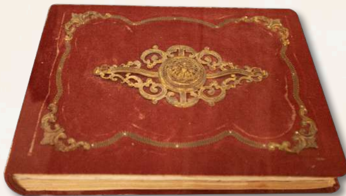
En el Museo "Mariano Matamoros" se encuentra el conocido libro rojo con anotaciones de "visitantes distinguidos" Anexamos solo algunos. Jantetelco Morelos, México. Diciembre de 2020.

«Cuernavaca, febrero 11 de 1974.» F. Leyva Gobernador de Morelos y miembro honorario de la «Sociedad Matamoros»